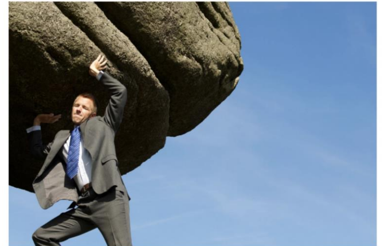
'Sociaal werk is Sisyphusarbeid'